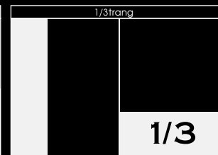
Độc: 7.3cm x 28.5cm Ngang: 22cm x 9.3cm