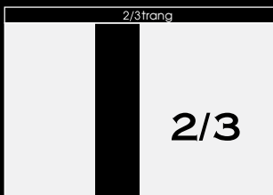
Độc: 14cm x 28.5cm Ngang: 22cm x 19cm